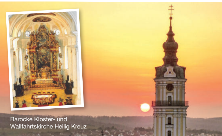
Barocke Kloster- und Wallfahrtskirche Heilig Kreuz