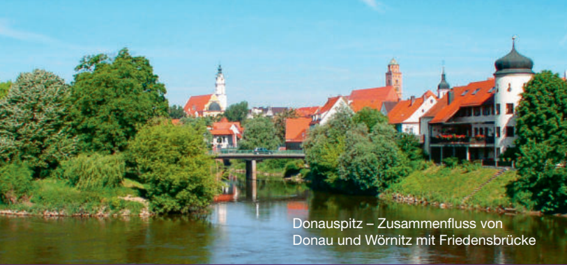
Donauspitz – Zusammenfluss von Donau und Würnitz mit Friedensbrücke