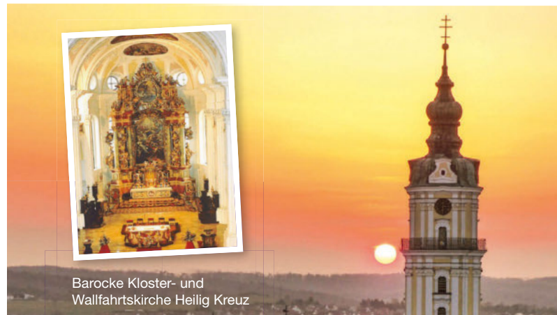
Barocke Kloster- und Wallfahrtskirche Heilig Kreuz