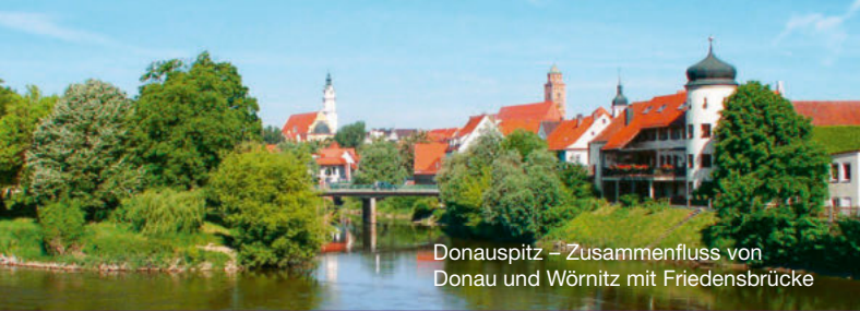
Donauspitz – Zusammenfluss von Donau und Würnitz mit Friedensbrücke