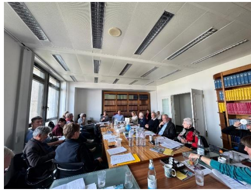
Bei der Arbeit.