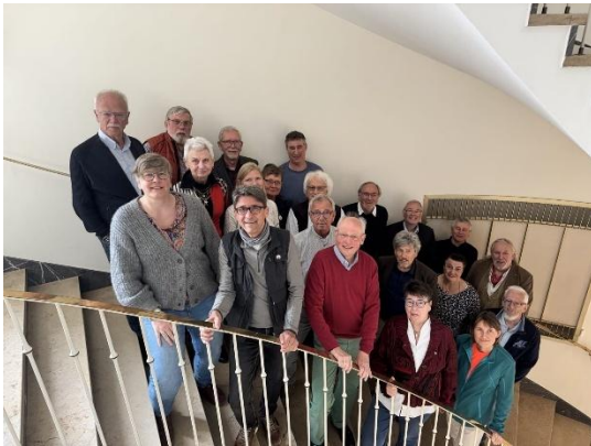
Die Vertreterinnen von 16 deutschen Jakobusvereinigungen auf einen Blick.